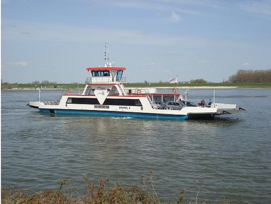
De veerpont Brakel-Herwijnen (19 april 2010)

De laatste jaren is de veerdienst van Gorinchem nog uitgebreid. In 2010 werd samengegaan met de veerdienst Aalst-Veen, die enkele kilometers ten zuiden van Gorinchem over de Afgedamde Maas vaart. En rond dezelfde tijd werd ook de veerdienst Brakel-Herwijnen aan de lijst toegevoegd. Bij beide veerdiensten is inmiddels ook een nieuwe veerpont in gebruik genomen, zodat we de veerdienst Riveer, zoals de veerdienst tegenwoordig heet, als een moderne veerdienst mogen bestempelen.