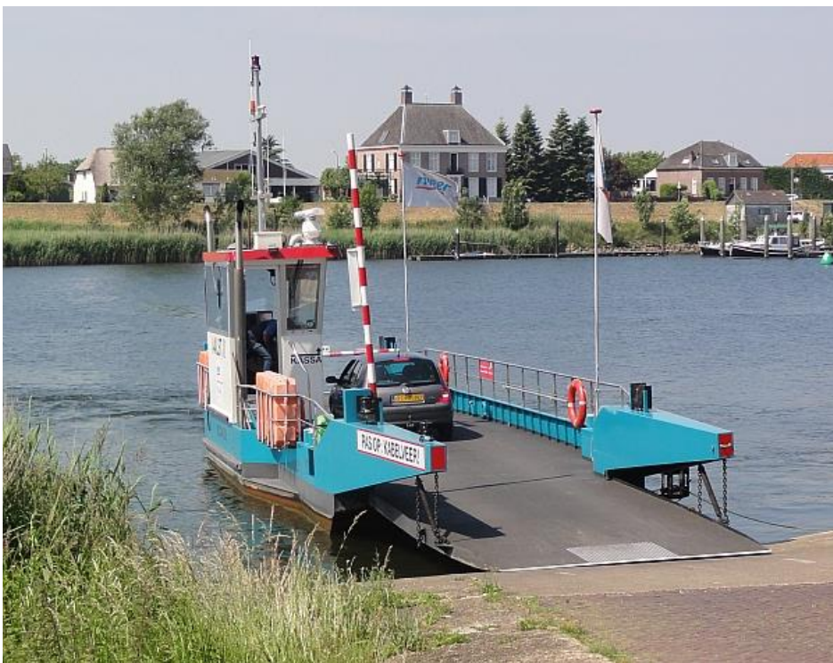
De veerpont Aalst-Veen (12 juni 2015)